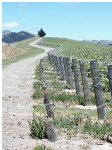
“Marlborough, Nya Zeeland”