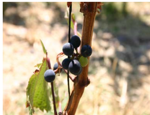
” Mendoza, Argentina”