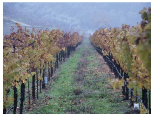
“Höst i Napa Valley”